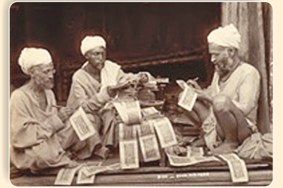
પ્રાચીન લેખન પદ્ધતિ

મંદિર છો મુક્તિતણી માંગલ્યકીડાના પ્રભુ, પરંતુ બધા શું બોલે છે? બધા મુક્તિતણા એમ બોલે છે. મુક્તિતણી માંગલ્યકીડા આ વ્યાકરણ